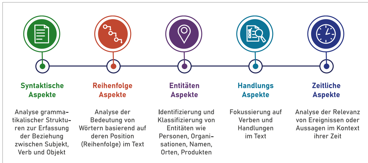
Abbildung 3: Intuition zum Attention-Mechanismus mit Aufmerksamkeitsaspekten