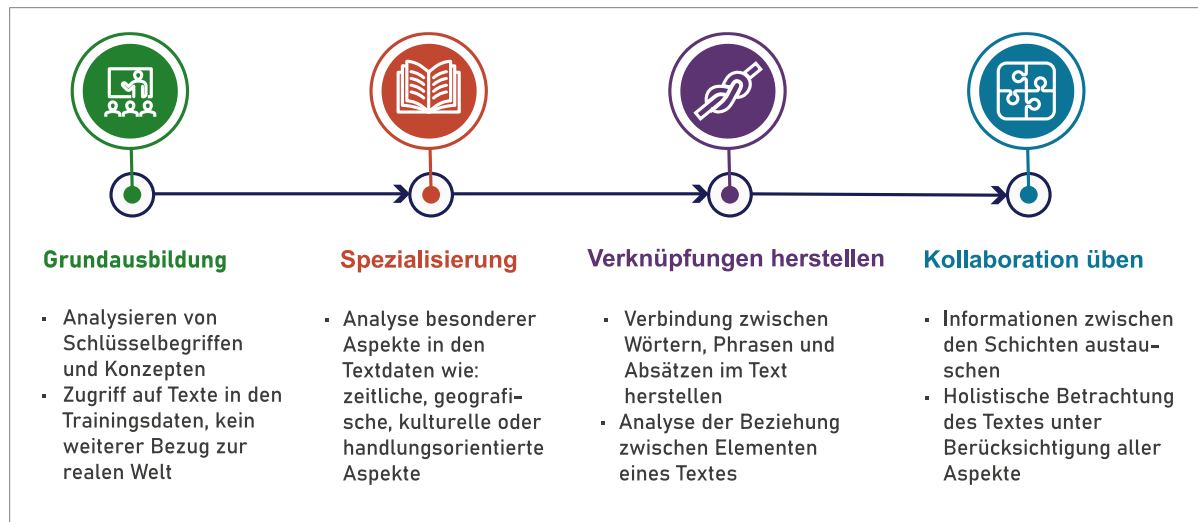
Abbildung 2: Intuition zum Training der Transformerschichten