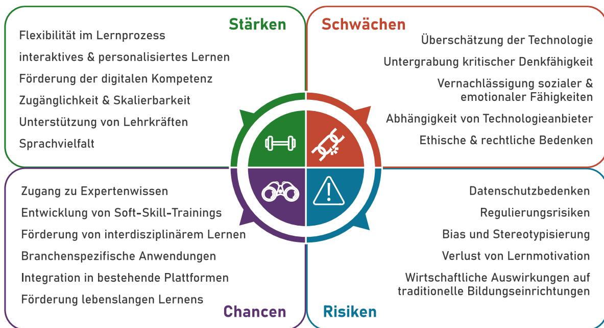
Abbildung 4: Stärken, Schwächen, Chancen & Risiken von Sprachmodellen in der beruflichen Weiterbildung

Dennoch müssen wir die Risiken dieser Technologie sorgfältig abwägen. Datenschutz ist ein wesentliches Anliegen, da Sprachmodelle oft mit sensiblen persönlichen Informationen arbeiten. Der Umgang mit diesen Daten muss strengen Datenschutzrichtlinien folgen, um Missbrauch zu verhindern.